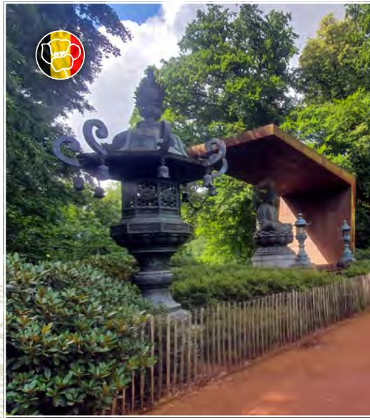
Domaine & Musée royal de Mariemont (Belgique)