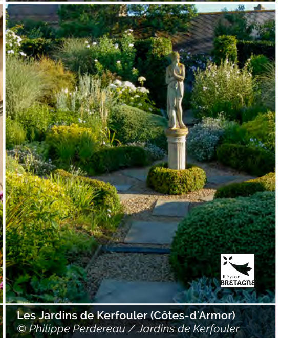
Les Jardins de Kerfouler (Côtes-d'Armor)

AAJRE 139 avenue du Maréchal Juin 06400 Cannes FR contact@aajre.org contact presse : akcrmedias@gmail.com www.aajre.org