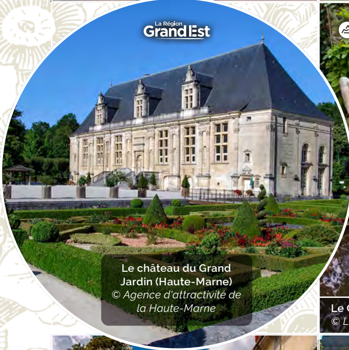
Le château du Grand Jardin (Haute-Marne)