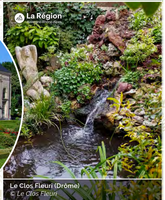
Le Clos Fleuri (Drôme)