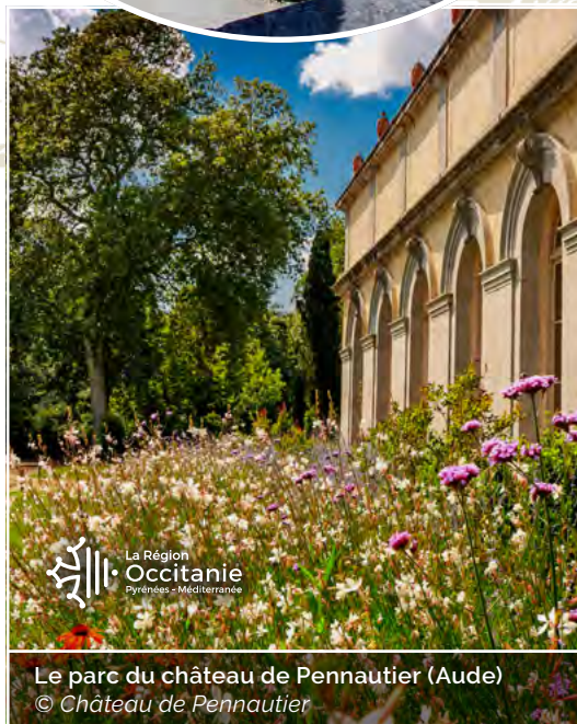
Le parc du château de Pennautier (Aude)